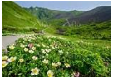
△ムーミン谷のチングルマとコマクサ大群落

⇒東北花の2名山を繋げた新コース。 秋田駒ヶ岳は花の大群落・ムーミン 谷をベストコースで周遊。登り辛い 大焼砂を下りに使う新コースでゆと りを持って歩きます。早池峰山は最 短コースの小田越から往復、いずれ も高山植物のベストシーズンに訪れ ます。石川啄木の里山・姫神山もブ ラス、一本杉峠から往復します。