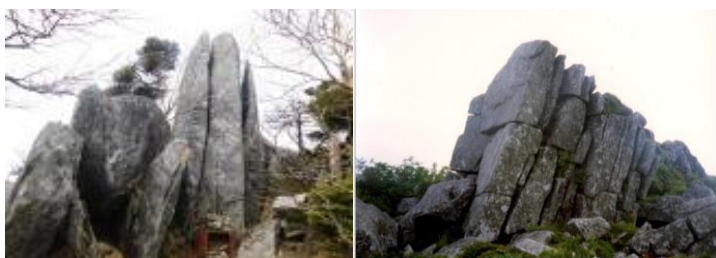
△日の出岩と黒岩頂上の重なる巨岩・古代巨石文明の痕跡か?