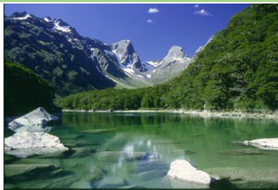
△ルートバーン・トラック Lake Mackenzie

ルートバーン・トラック2泊3日とフィヨルドランド大自然ウォーク2日間に、マウントクックでのハイキングをプラスしたトレッキング&ハイキングスペシャル11日間コース。ルートバーン・トラックの後、平野ガイドがフィヨルド