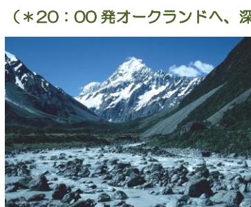
△フッカーバレーからマウントクック