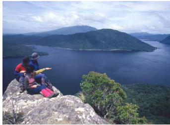
▽LOOKOUT BLUFF からハウロコ湖

コロミコ・トレックのかつての本拠地テ・アナウに4連泊して、フィヨルドランドの大自然をご案内します。