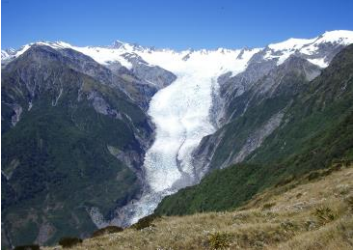
△アレックスノブからフランツジョセフ氷河

■日程：①*夕方、NZ便でオークランドへ。②〜クィーンズタウン〜ワナカ泊 ③ロブロイ氷河ハイキング〜ワナカ泊 ④〜フォックス氷河〜マセソン湖〜フランツジョセフ氷河泊 ⑤アレックス・ノブ ハイキング〜フランツジョセフ氷河泊 ⑥〜ホキティカ〜グレイマウス〜マルイアスプリングス泊 ⑦ラフサドル ハイキング〜マルイアスプリングス泊 ⑧ルイストップ半日ハイキング〜クライストチャーチ泊 ⑨〜クライストチャーチ空港⇨*オークランド(*NZ便で成田へ、16:40着)