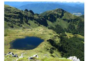
△ラフサドル・大滝上の山上湖