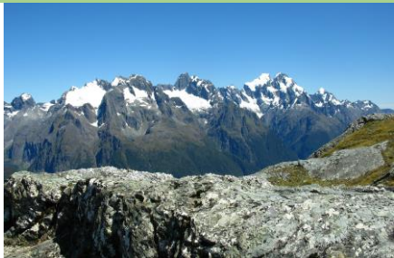
△コニカルヒルからダーラン山脈 △マッケンジー湖