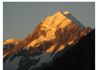
△マウントクック山景