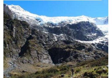
△ロブロイ氷河/氷河展望フラットから