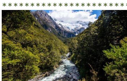
△ロフロイ氷河 △ベン・ローモンド山