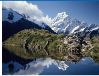
△セアリーターズから Mt.Cook

クライストチャーチからマウントクック、クィーンズタウン、テ・アナウまで、平野ガイドが全行程ドライブ、各地でのハイキングもすべてご案内します。