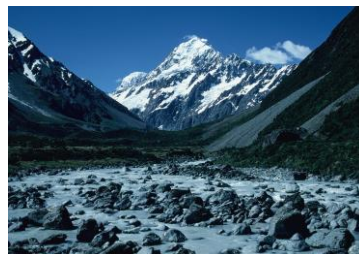
△フッカーバレーからマウントクック南峰

☞②③④テアナウ3泊：マナポウリ・モニュメント、ミルフォード・サウインド+キー・サミット ⑤レイク・ハウロコクイーンズタウン泊 ⑥マウントクック、フッカー・バレーハイキングマウント・クック泊 ⑦レッド・ターズープカキ湖-テカ泊(夜、ニュージーランドのスター・ウォッチング) ⑧アーサーズパス国立公園・ピーレー尾根-マルイア温泉泊⑨ラフサドル原生林ウォーク、マルイア温泉泊 ⑩ールイス峠-クライストチャーチ泊(ハグレイ公園ほか市内周辺ドライブと散歩、大型アウトドアショップ、スーパーでの買い物など)