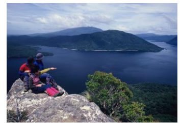
△LOOKOUT BLUFF からハウロコ湖

ニュージーランド・ハイキングのメッカ・フィヨルドランド国立公園に今なお残る大自然を巡る、究極の大自然ウォーク。フィヨルドランドを歩いて30年、平野ガイドが開拓したフィヨルドランド南部の原始境・マナポウリとハウロコ湖でのハイキング・ツアーが復活。コロミコ・トレックのかつての本拠地・アナウに3連泊して、他のいかなるツアーでも、また個人でも絶対に体験できないニュージーランドの大自然をご案内します。