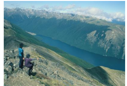
△ネルソンレイクス、ロトイチ湖