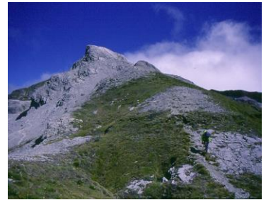
△Mt.アーサーへの尾根、白亜のピーク

南島最北部に位置するカフランギ国立公園では、モツエカの町をベースに大理石の山 Mt.Arthur を日帰り往復。その後、アーサーズ・パスとネルソンレイクスの2つの国立公園を巡り、NZ 最大級のブナ純林が広がるマルイアールイスパス国定自然保護区での原生林ウォークなど、ニュー