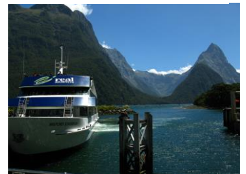
△ミルフォードサウンド