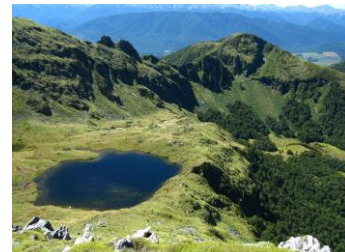
△ラフサドル・山上湖