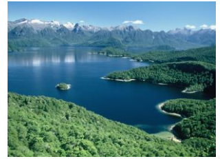
△モニュメント頂上からマナポウリ湖

ニュージーランド・ハイキングツアーのパイオニア・平野洋一が現地ガイドするニュージーランド大自然ウォーク・シリーズ。2018年1月から新企画コースを含め実施する予定です。NZ環境省から認可されたオリジナルの各コースを中心に、ニュージーランドの大自然を知り尽くした平野ガイドならではの大自然ウォークと快適なドライブで皆さんをご案内します。これまでと一味違う本物のNZの大自然満喫の山旅、ご期待下さい。