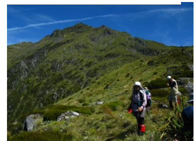
△ラフサドル、最高ピークへの尾根道 ◁森の人気者、ブッシュ・ロビン