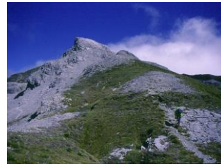
△Mt.アーサーへの尾根、白亜のピーク

南島最北部に位置するカフランギ国立公園では、モツエカの町をベースに大理石の山 Mt.Arthur を日帰りして往復。その後、アーサーズ・パスとネルソンレイクスの2つの国立公園を巡り、NZ 最大級のブナ純林が広がるマルイアールイスパス国立自然保護区での原生林ウォークなど、ニュージーランド南島中北部の大自然を巡る大周遊ドライブ&山旅9日間。これまで何度ニュージーランドを訪れた人でも決して体験したことがない平野ガイドのみ案内可能なニュージーランドの大自然スペシャルコースです。