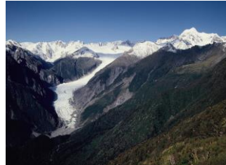
△Mt.Fox からフォックス氷河とタスマン山