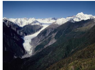
△Mt.Fox からフォックス氷河とタスマン山