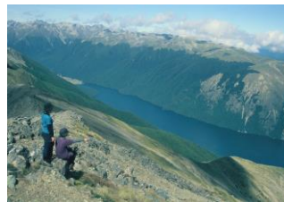
△ネルソンレイクス、Rotoiti 湖